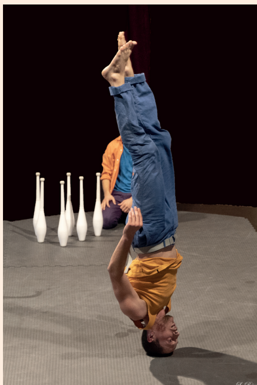
La fabuleuse histoire de Basarkus

En 2022, la Fabuleuse Histoire de Basarkus , créée par Sylvère Lamotte, a tourné dans les écoles d'Aubervilliers et repris la route en 2023 dans les écoles de la ville de Saint-Ouen, au festival Spring-métropole Rouen-Normandie 2023 et au TOTEM, scène conventionnée Art, enfance, jeunesse, à Avignon.