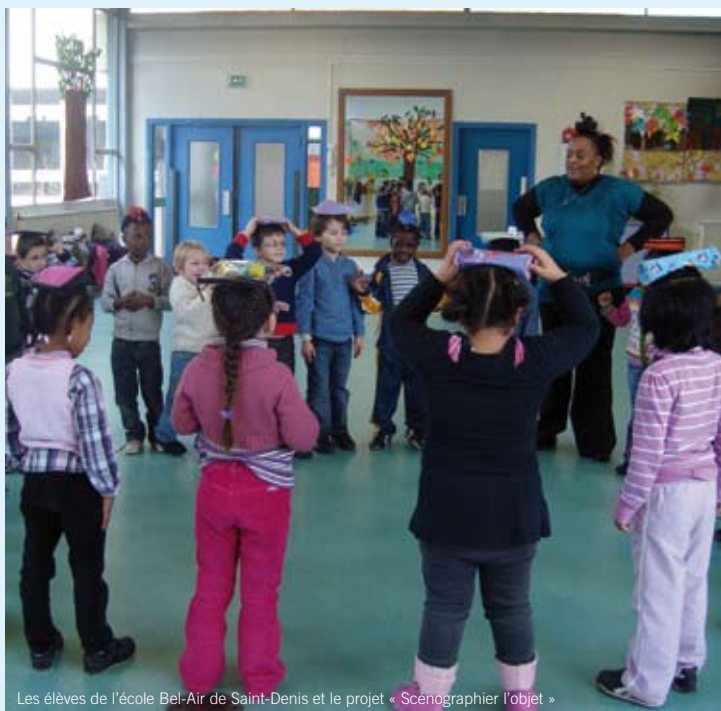
Les élèves de l'école Bel-Air de Saint-Denis et le projet « Scénographier l'objet »