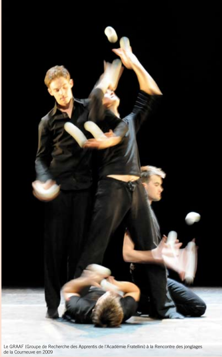
Le GRAAF (Groupe de Recherche des Apprentis de l'Académie Fratellini) à la Rencontre des jonglages de la Courneuve en 2009

Le plaisir de la rencontre entre les apprentis et un metteur en scène est souvent partagé. Coline Serreau, qui a travaillé avec les apprentis (principalement de 1 ère année) pour « Hip Envolee Hop », a trouvé l'équipe magnifique. « C'était un bonheur de travailler avec eux. Et je suis ravie de les retrouver pour le spectacle de Noël 2010. Comme on a déjà une expérience commune, on pourra aller encore plus loin. Ils ont davantage confiance, et nous perdrons moins de temps à nous regarder en chiens de faïence, comme c'est souvent le cas au démarrage d'une collaboration artistique. « Hip Envolee Hop » a connu un beau succès. Rien de tel pour souder une équipe ! Ceci dit, un succès n'en entraîne pas forcément un deuxième. Il nous faudra redoubler de vigilance et de travail. Dans le plaisir et la confiance réciproques ! »