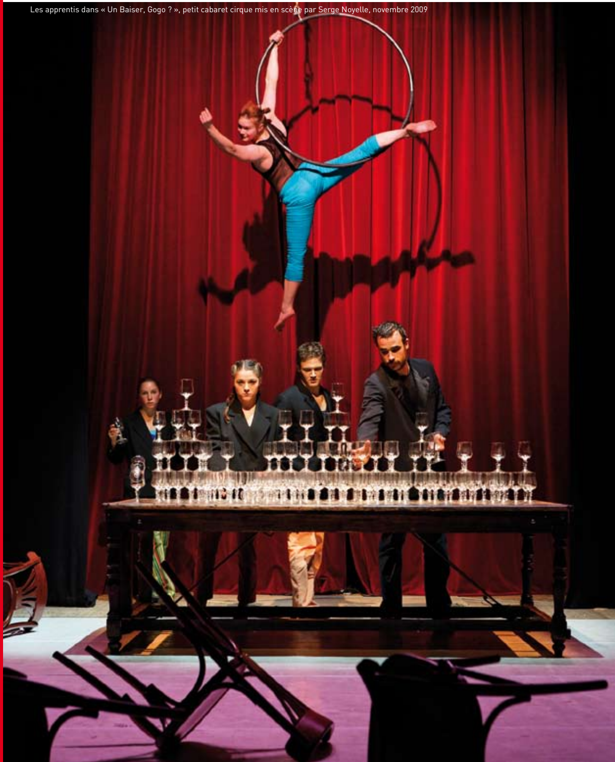
Les apprentis dans « Un Baiser, Gogo ? », petit cabaret cirque mis en scène par Serge Noyelle, novembre 2009