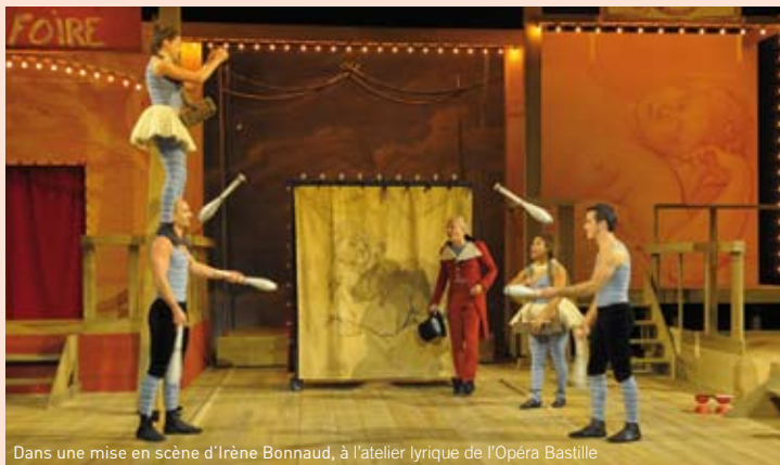
Dans une mise en scène d'Irène Bonnaud, à l'atelier lyrique de l'Opéra Bastille

Que rêver de mieux lorsqu'on se destine à une carrière artistique que de se produire régulièrement en public ? Au cours de leurs trois années de formation, les apprentis ont la chance de travailler avec de nombreux professionnels, d'accumuler les expériences devant des publics très divers. « C'est un concentré d'apprentissage », explique Coline Ser-